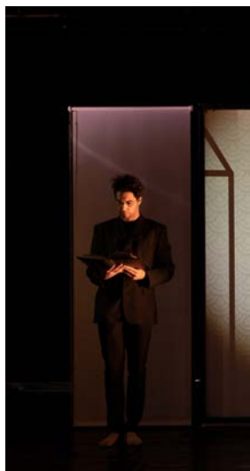
texte Achille Sauloup