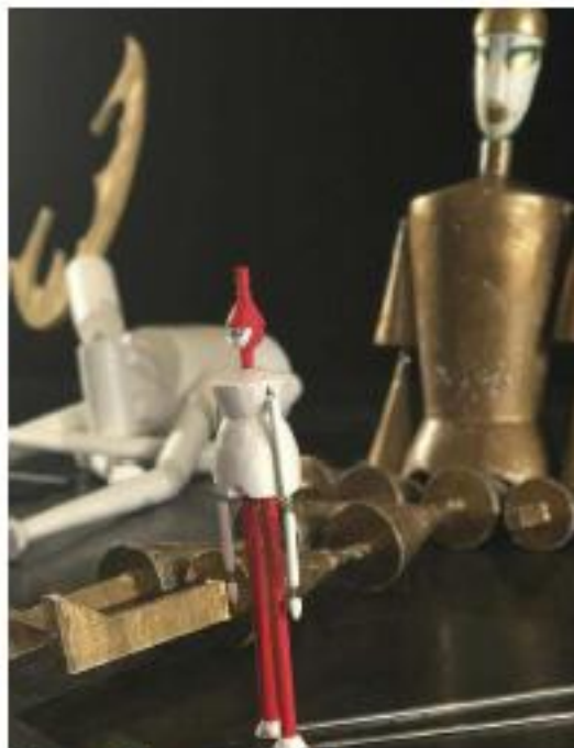
Dadaa sera créé en mars prochain au TJP