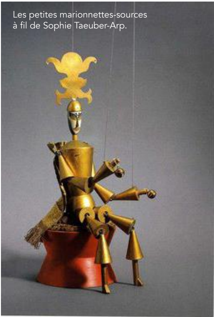
Les petites marionnettes-sources à fil de Sophie Taeuber-Arp.