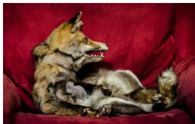
Les Animaux Inéluçables , 2014 créé à Charleville Mézières, France