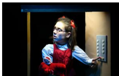
Kas Tu? , 2015 créé à Klaipeda, Lituanie