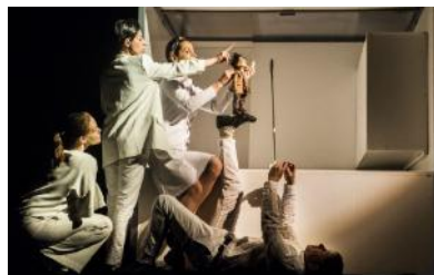
Kryptis , 2017 créé à Vilnius, Lituanie