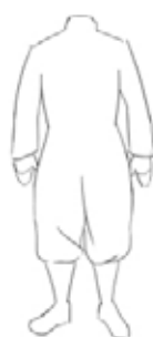
Forme de Base