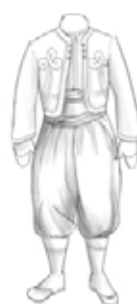
Zouave (tirailleur Algérien)